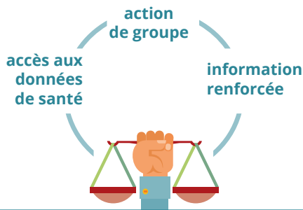
loi du 26 janvier 2016